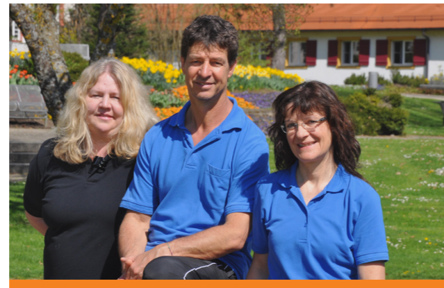
Das Team der Physikalischen Therapie